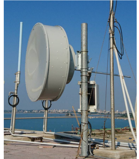
Enlace de Microonda KM

rango de frecuencia de 54 a 600 MHz. El receptor de microondas se conecta directamente a la red de cable local sin necesidad de convertidores de frecuencia ni de ningún otro equipo. El sistema de microondas proporciona servicio de televisión por cable a los suscriptores del sistema de cable en la isla, sin la necesidad de instalar una nueva cabecera.